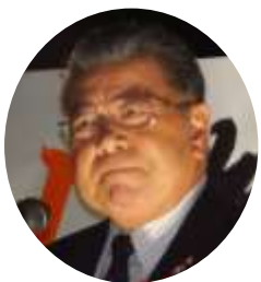
呉屋守将 共同代表