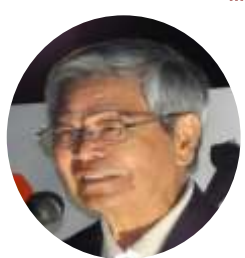
仲里利信 前衆院議員