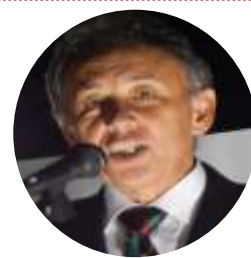
玉城デニー 衆院議員