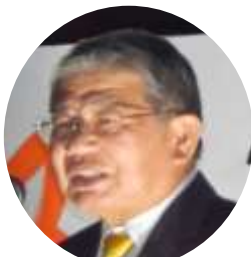
赤嶺政賢 衆院議員