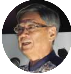
翁長雄志 沖縄県知事