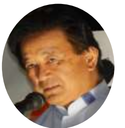
伊波洋一 参院議員